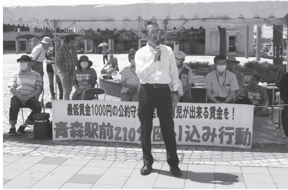
駅前公園の210分の座り込み

発行所 青森県労働組合総連合（青森県労連） 〒030-0852 青森市大野若宮 165-19 Tel 017-762-6234 発行人 青森県労働組合総連合（毎月5日発行）定価 10円 1992年10月30日 第三種郵便物認可 本紙の購読料は組合費に含まれています。