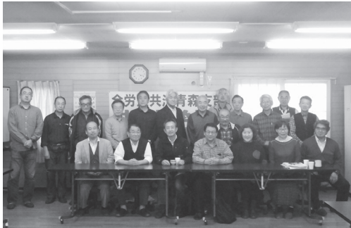
昨年11月の共済学校

を提案しました。全労連共済青森支部の到達点について、組織共済213名、火災共済53名、交通災害共済30名、共済分所5団体にそれぞれ前進したと報告しました。また、年金者組合むつ支部は組織共済に25名の組合員全員が加入、自動車共済・火災共済・個人賠償責任共済を宣伝、組合加入につながっている経験も紹介しました。参加者から自動車共済と医労連自動車共済との合併が見送られたのはなぜか、との質問があり、自動車共済に代理店