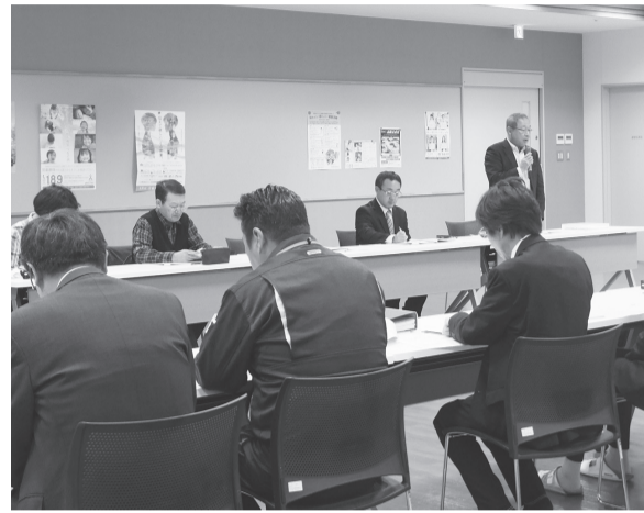
医療費無料を高校まで拡大した南部町

きも見られる③子どもの医療費無料化(通院・入院とも)が中学生まで(28自治体)、高校生まで(新たに深浦町・南部町、計7自治体)に拡大④新入学者への就学援助の前年度支給が大きくなる⑤就学援助費(新入児童生徒学用品費)の単価