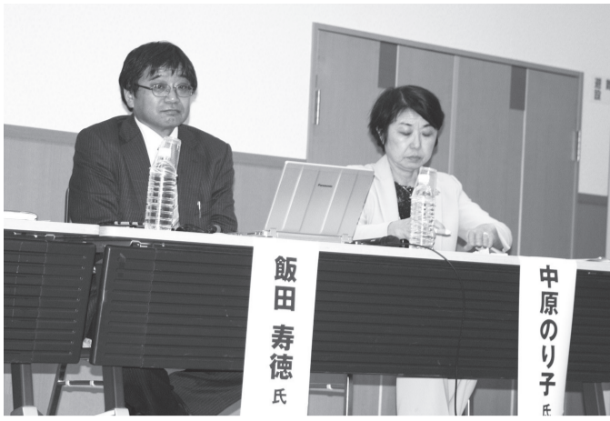
記者会見で菅官房長官を鋭く追及したことで名を馳せている東

年金者組合や保健生協等15団体による第20回県高齢者大会が11月23日、青森市文化会館で開催され、県内各地から会場いっぱい425名が参加しました。この大会は、「すべての世代の連帯で、いかそう憲法、つくろう安心して暮らせるまちを」をスローガンに開催されたものです。