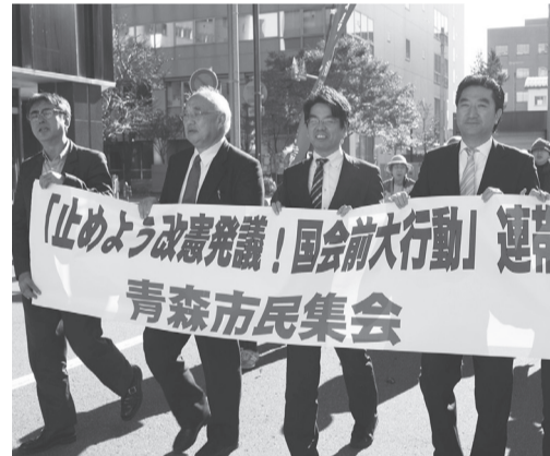
3野党も参加した市民集会

立憲民主党、国民民主党、共産党、社民党の代表が参加、市民と野党共闘で憲法を守るうとエールを交換しました。同日、国会前行動に連帯して