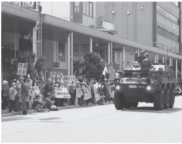
青森市内での軍事パレード

弘前市でも例年秋に、陸上自衛隊弘前駐屯地が軍事パレードを実施しています。過去最高の軍事費5兆2千億円の予算を組んでいます。F35ステルス戦闘機42機と無人偵察機グローバルホーク3機を購入、三沢基地への配備や無用な軍事パレードを止めて教育や社会保障に廻