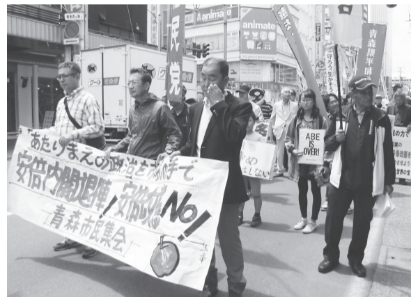
6/10 中央と連帯した青森市民集会

青森市では、中央の集会に連帯して、青森市民集会在開催され、80人余が参加しました。県9条の会や県労連など11団体が