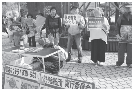
青森駅前の金曜日行動

5月4日、青森市の駅前公園で、「原発なくそう!核燃いらない!あおもり金曜日行動」が実施され、市民など30名が参加しました。2011年の東日本大震災による福島原発事故の悲劇を繰り返させない思いから青森市の「金曜日行動」は、2012年の8月10日から開始され300回を迎えました。肌寒い中、1時間にわたって参加者は各々の思いをスピーチした後、30分間のデモを実施、市民に東通原発再稼働反対、大間原発