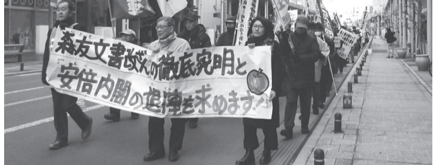
青森市 安倍退陣を求めるデモ

森友文書改ざんの中心人物の佐川前理財局長の証人喚問と改ざん徹底究明、安倍内閣退陣を求める運動が県内で展開されています。青森市では3月16日、県9条の会や県労連、憲法ネット、共産党、社民党など11団体による「森友文書改ざん問題の徹底究明と安倍内閣退陣を求める緊急集会」が開催され、120名が参加しました。金澤茂県9条の会共同代表は、森友文書改ざんの徹底究明と安倍内閣退陣、3000万署名に全力を挙げようと訴えました。