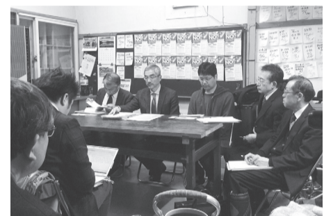
弘大職組の記者会見

シール投票と3000万署名(新婦人)、米軍の燃料タンク投下への抗議(平和委員会)、ヒバクシャ国際