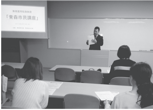
青森市の市民講座

改正労働契約法により「同一の使用の下で、通算5年を超えて有期労働契約が更新された場合、労働者が申し入れることで無期労働契約に転換できる」制度が4月1日から本格的にはじまります。(2013年4月1日開始の労働契約から対象)