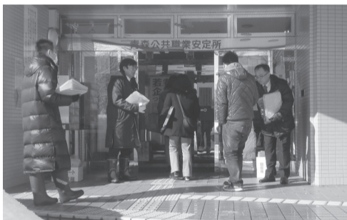
青森職安前の調査活動

参加者から「使用者から説明がない」「最長5年までと何回も言われた」「クーリングと思われる期間を置くと言われ