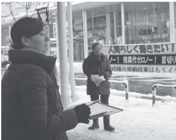
月2回の街宣・署名行動