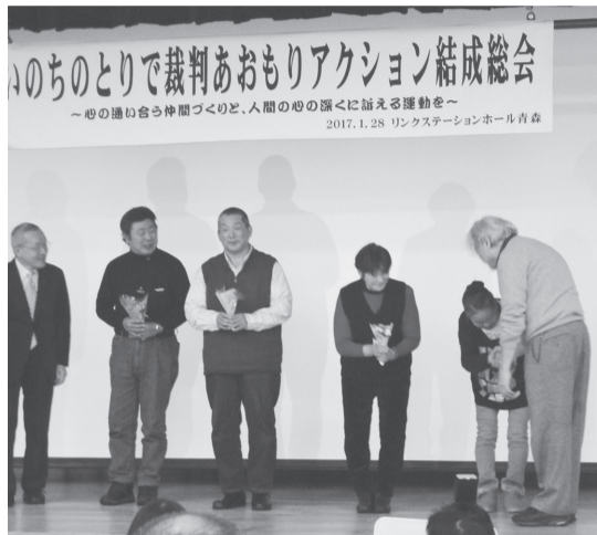
原告団に激励のブーケ贈呈

春闘方針を提案しました。その主なものは、①春闘山場にストを配置して闘う②最賃引き上げでの中小企業団体との懇談③残業代ゼロ法案等の労働法制改悪反対④社会保障改悪阻止⑤「国際ヒバクシャ署名」の推進⑥「3・11青森集会」(今年は3月5日開催)、大間原発反対現地集会(7/6)への参加⑦共謀罪阻止、憲法記念日集会の取組み等です。 方針提起を受けて参加者から取り組みの決意が出されました。医労連は社会保障闘争と大幅賃上げをめざして1時間以上のストの配置、農協労組は秋闘で県内すべての分会での決算手当の獲得と17春闘での賃上げ、県国公は定員増と2つの訴訟(賃金カットの違憲訴訟、社保庁解雇撤回)、JMITUは大幅賃上げのためのストの配置とチラシまき行動について発言がありました。