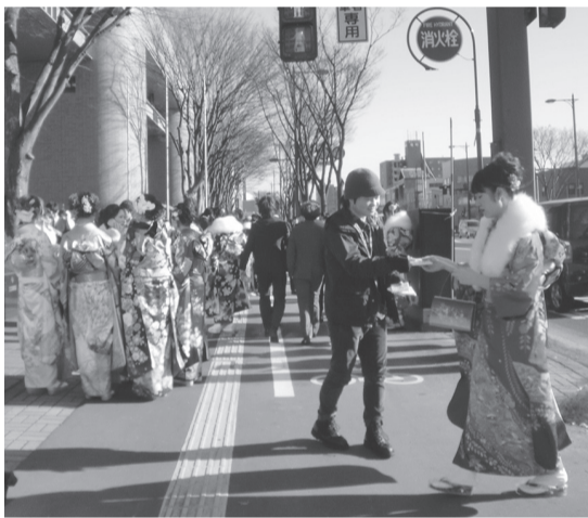
百花繚乱の成人式 青森市

青森市の成人式は1月の第2日曜日、8日に行なわれました。いつもは会館の中で開場を待つ新成人は、穏やかな晴天の太陽に誘われて、外にドット溢れまじった。再会の喜びと晴がましさを、女性の晴れ着が男のスーツを圧倒し、百花繚乱の花園。心を躍らせながら「労働相談」ティッシュを配布しました。「成人おめでとう」「ありがとうございませす」こんな気分のいいティッシュ配りはありません。