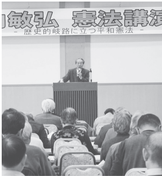
憲法公布日の憲法講演会

い社会と地域再生の手がかりがあります。 2日目は会場を盛岡市に移して開催され、12道県から272名、青森県から20名が参加しました。全国交流集会が岩手県で開催されたのは、高レベル放射性廃