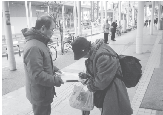
寒い中での月2回の街宣

しかし、自公政権は、残業代がゼロになる「高度プロフェッショナル制度」を柱とする「労働基準法等の一部を改正する法律案」を昨年4月に国会上程しており、過労死促進法と言われています。長時間労働が社会問題として取り上げられており、長時間労働を規制するためには、4野党の長時間労働規制法案の成立が不可欠です。