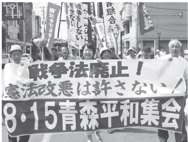
高橋衆院議員を先頭に行進

県九条の会などの12団体は、「戦争法廃止! 憲法改悪は許さない! 8・15青森平和集会」を青森市の青森駅前公園で開催し、青森市民など115人が参加しました。主催者を代表して九条の会の金澤茂共同代表は、参議院選挙で改憲勢力が3分の2を占めたことに触れ「憲法を死に物狂いで守らなければならない」、「野党共闘が一定の成果を挙げ、今後の運動に希望と展望を与えた」とあいさつしました。政党から民進党の升田世喜男衆院議員、日