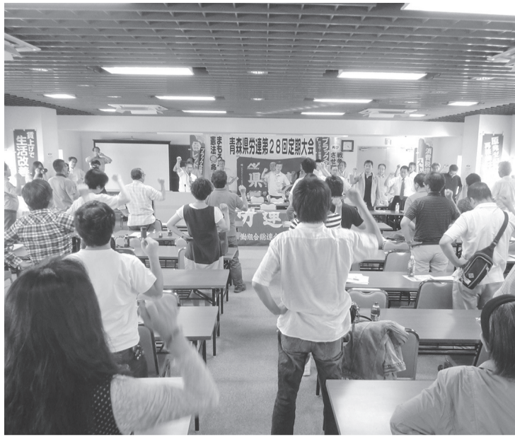
ガンバロウ三唱する参加者

発行所 青森県労働組合総連合(青森県労連) 〒030-0852 青森市大野若宮 165-19 Tel 017-762-6234 発行人 青森県労働組合総連合(毎月5日発行) 定価 10円 1992年10月30日 第三種郵便物認可 本紙の購読料は組合費に含まれています。