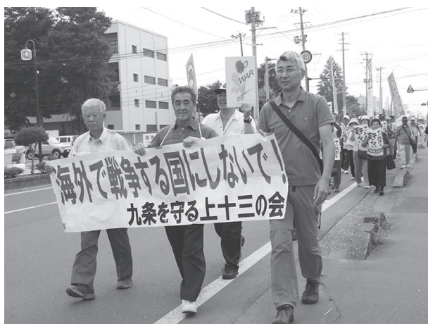
50名が参加した十和田市のデモ