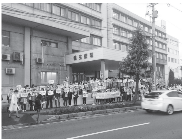
弘前の150人のスタンディング行動