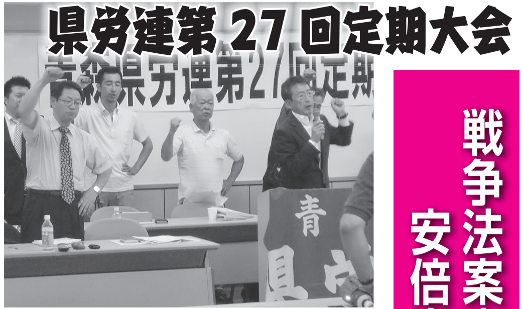
団結がんばろう三唱

発行所 青森県労働組合総連合(青森県労連) 〒030-0852 青森市大野若宮 165-19 Tel 017-762-6234 発行人 青森県労働組合総連合(毎月5日発行) 定価 10円 1992年10月30日 第三種郵便物認可 本紙の購読料は組合費に含まれています。