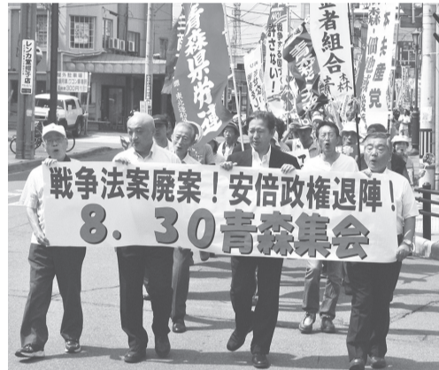
600人が参加した青森集会

むつ市ではマエダストア前でそれぞれ街頭宣伝を実施しました。十和田市は50人の参加で集会とデモ行進を行い、七戸町では戦争法案の学習会を開催しました。青森市浪岡では50人の参加で集会を開催しました。