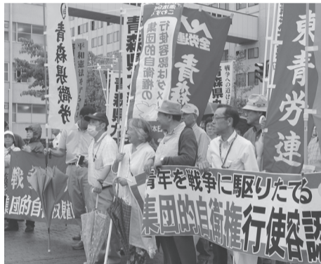
小雨の中170名以上参加

で戦争する国づくり許さない8・15青森平和集会」が開催されました。降り続く小雨にもかかわらず170名余が集まりました。