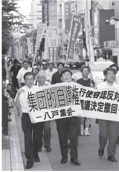
“閣議決定は撤回しろ!” 八戸地区の緊急集会

閣議決定日を前後して、県内でも緊急行動が相次ぎました。7月4日には、青森市・青い森公園で集团的