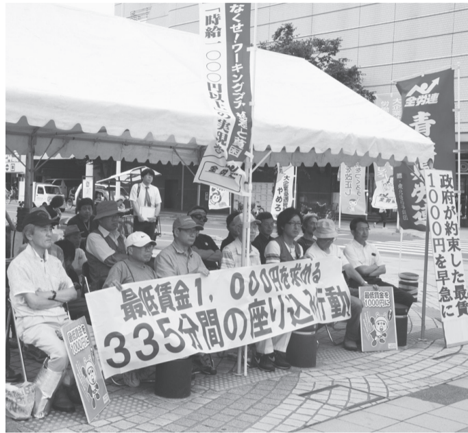
座り込み中の参加者(青森駅前公園)