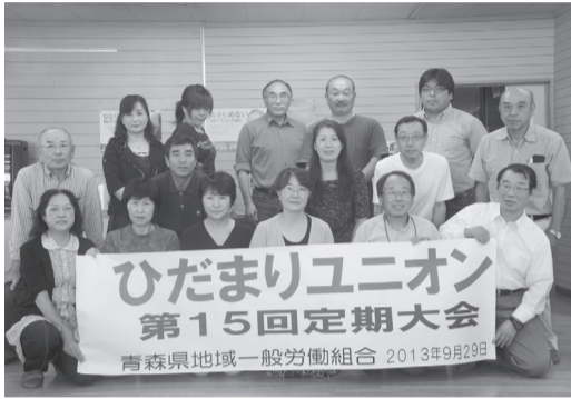
昨年、第15回定期大会の記念写真

れば誰でも、一人でも加入出来ます。組合員数は7月末現在177名で、15年前の約9倍。最高時には、256名にまで達したことがあります。加入と脱退が激しいのが特徴です。安倍政権下の厳しい労働・雇用環境の情勢を反映して、労使間や職場内トラブルは頻繁に発生、内容は多種多様です。ひだまりユニオンは、労働者にとって“駆け込み寺”的な存在と言えます。労働法制と紛争解決実務に