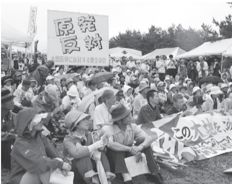
憲法ネットからも210名参加

7月20日、大間町で現地集会実施。実行委員会による「第7回大間原発反対現地集会」が開催され、京・神奈川・新潟など全国各地から、過去最高の600名が参加しました。特に、大間原発建設差し止めに、国と電源開発(J