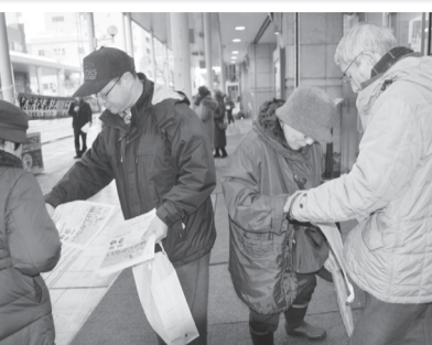
廃止求め街頭署名行動

憲法の基本原則を根底から蹂躪する秘密保護法。法案強行可決後も、国民の反対の声は高まり、全国で廃止を求める運動が盛り上がり続けています。