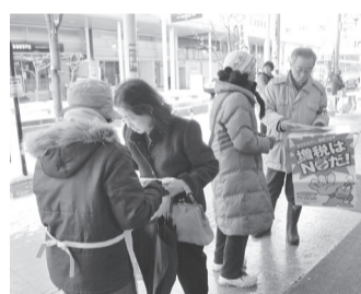
東青各界連絡会の街宣

などの課題で行動を提起。医労連、高教組、県国公の3単座から決意表明、集会アピール採択、ガンバロー唱和と続き、デモ行進に移りました。時折、陽が差す好天に恵まれ、力強いシュプレヒコールで市民にアピールしました。